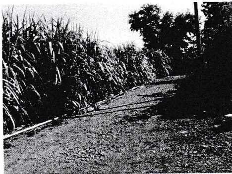
กม.0+420 (จุดสิ้นสุดโครงการ)