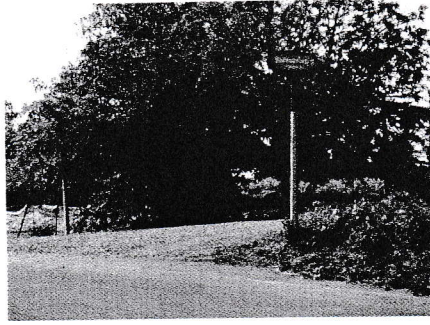
กม.0+000 (จุดเริ่มต้นโครงการ)