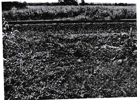
กม.0+800 (จุดสิ้นสุดโครงการ)