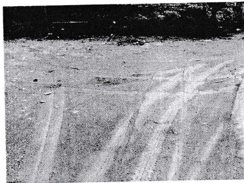
กม.0+207 (จุดสิ้นสุดโครงการ)