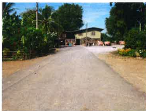
กม.0+200 (จุดสิ้นสุดโครงการ)