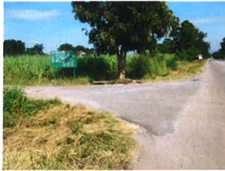
กม.0+000 (จุดเริ่มต้นโครงการ)