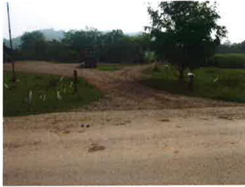
กม.0+000 (จุดเริ่มต้นโครงการ)