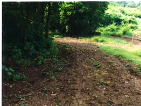
กม.0+979 (จุดสิ้นสุดโครงการ)