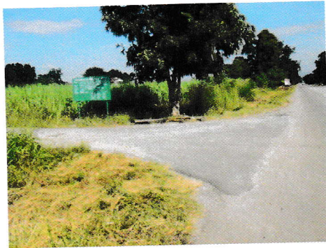
กม.0+000 (จุดเริ่มต้นโครงการ)