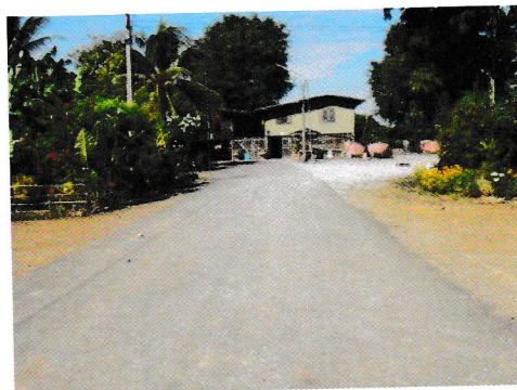
กม.0+200 (จุดสิ้นสุดโครงการ)