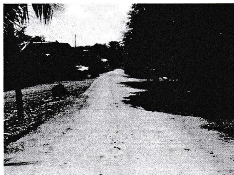
กม.0+343 (จุดสิ้นสุดโครงการ)