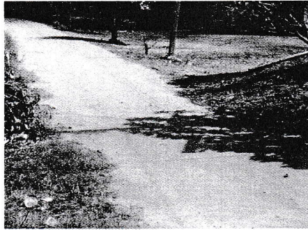
กม.0+000 (จุดเริ่มต้นโครงการ)