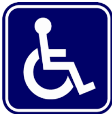
สัญลักษณ์ผู้พิการ