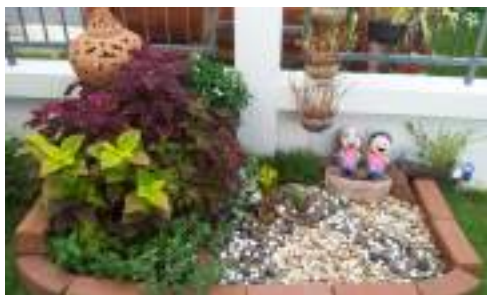
สวนหย่อม