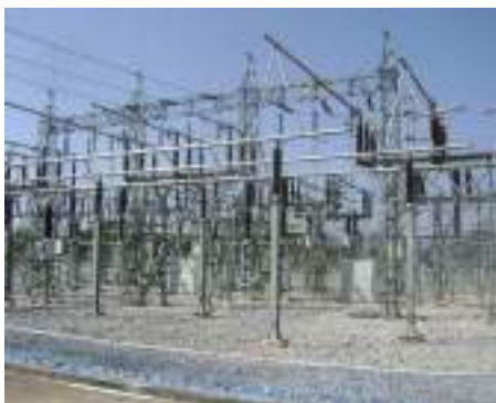
ลานโกไฟฟ้า