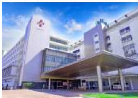
สถานพยาบาล