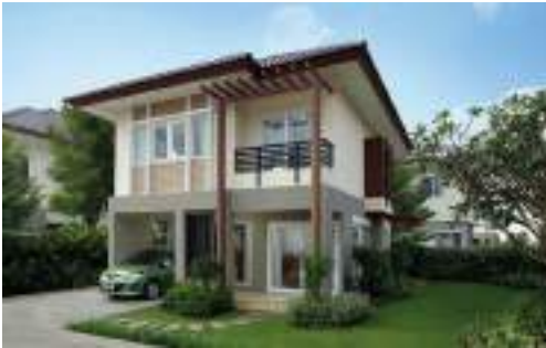
บ้านเดี่ยว