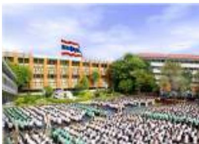
สถานศึกษา