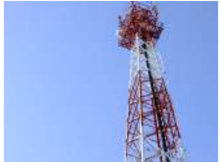
เสาส่งสัญญาณอินเทอร์เน็ต