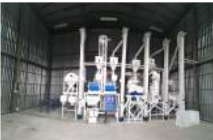
โรงสีข้าว