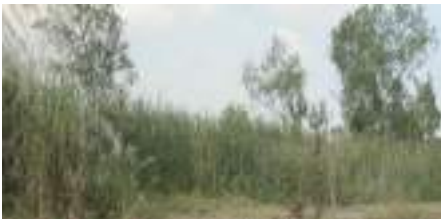
ที่ดินรกร้างไม่ได้ใช้ประโยชน์

(2) ที่ดินที่ไม่เป็นกรรมสิทธิ์ของบุคคลธรรมดาหรือนิติบุคคล แต่อยู่ในความครอบครองของบุคคลธรรมดาหรือนิติบุคคล เช่น สปก. 4, ก.ส.น., ส.ค.1, นค.1, นค.3 ส.ท.ก.1 ก, ส.ท.ก.2 ก, นส.2 (ใบจอง) และที่ดินอันเป็นทรัพย์สินของรัฐ ซึ่งมีการเข้าไปครอบครองหรือทำประโยชน์ ฯลฯ เป็นต้น