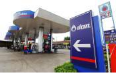
สถานีบริการน้ำมัน