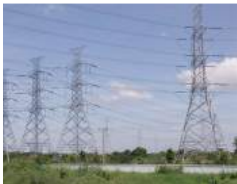
เสาไฟฟ้า