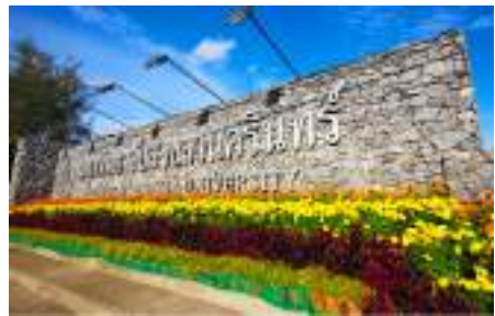
ตัวอย่างป้ายที่ไม่ต้องเสียภาษี