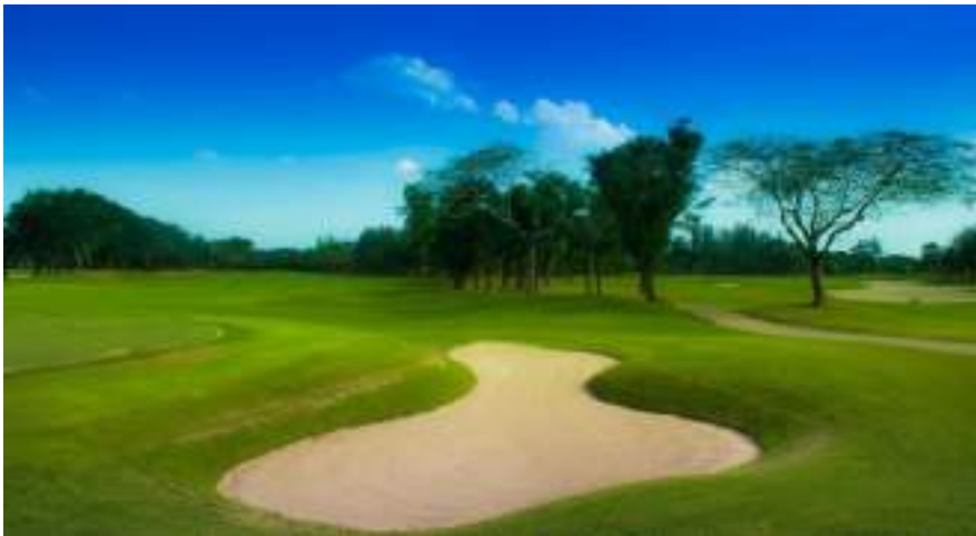
สนามกอล์ฟ จัดเป็นธุรกิจการกีฬา จึงได้รับการลดภาษี

1.4 ลดภาษีร้อยละ 90 ของจำนวนภาษีที่จะต้องเสียของทรัพย์สินที่ใช้เป็นสถานที่เล่นกีฬา สวนสัตว์ สวนสนุก หรือที่จอดรถสาธารณะ