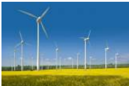
กังหันลม

ตัวอย่างสิ่งปลูกสร้างที่อยู่ในข่ายได้รับการยกเว้นภาษี