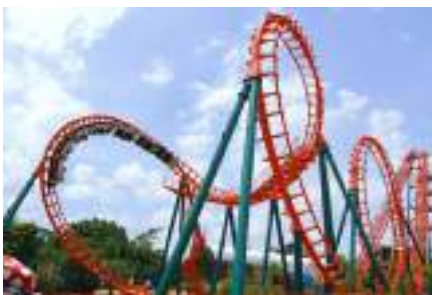
เครื่องเล่นในสวนสนุก