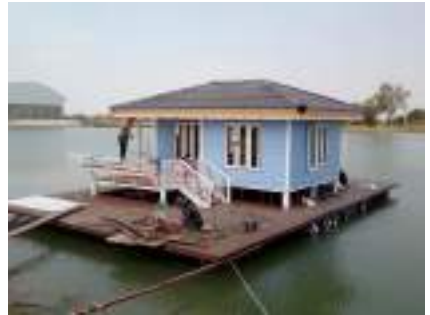
บ้านเรือนแพ