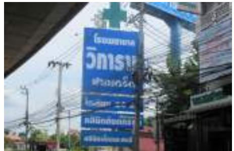
ตัวอย่างป้ายที่ต้องเสียภาษี

หากในกรณีที่ไม่มีผู้มาขึ้นแบบแสดงรายการภาษีป้าย หรือเจ้าหน้าที่ไม่สามารถติดต่อหรือหาตัวเจ้าของป้ายได้ ให้ถือว่าผู้ครอบครองป้ายมีหน้าที่เสียภาษีป้าย แต่ถ้าหาตัวผู้ครอบครองป้ายไม่ได้ เจ้าของหรือผู้ครอบครองที่ดินที่ติดตั้งป้ายจะต้องเป็นผู้เสียภาษีป้ายแทน ตามลำดับที่กล่าวมา