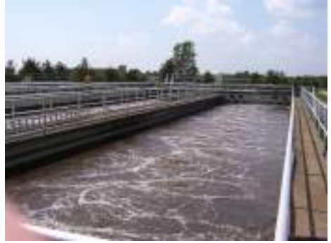
บ่อบำบัดน้ำเสีย