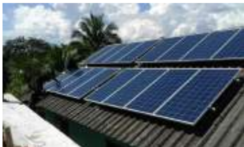
แผงโซลาเซลล์