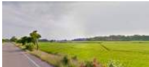
ที่ดินที่ใช้ทำกสิกรรม