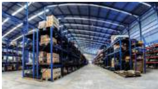
คลังสินค้า