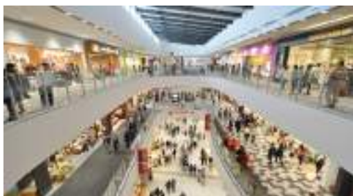
ห้างสรรพสินค้า