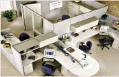
สำนักงาน