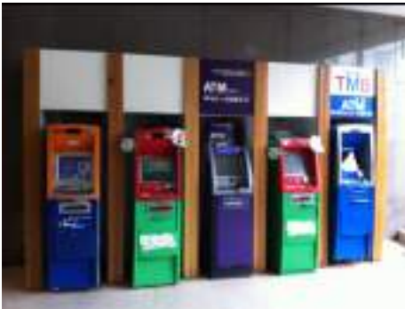
ตู้ฝากถอนเงินสด

ตัวอย่างสิ่งปลูกสร้างที่อยู่ในข่ายได้รับการยกเว้นภาษี