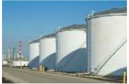
ถังเก็บน้ำมันบนดิน