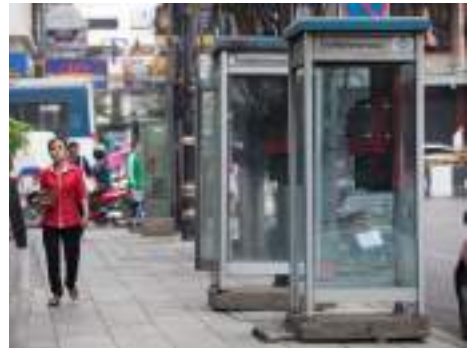
ตู้โทรศัพท์สาธารณะ