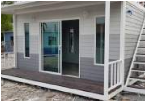
บ้านประกอบเสร็จ