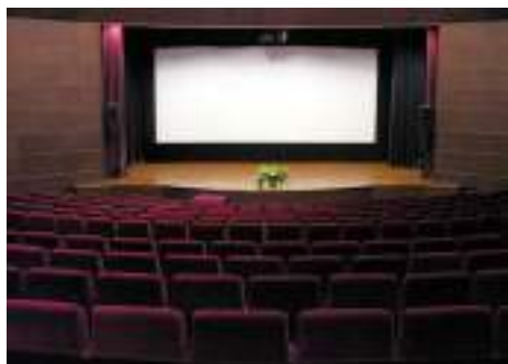
โรงมหรสพ