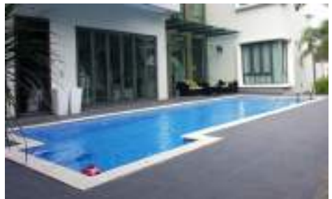
สระว่ายน้ำ