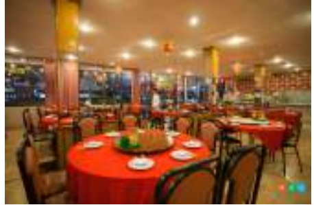
ภัตตาคาร