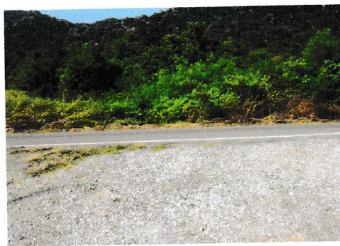
กม.1+350 (จุดสิ้นสุดโครงการ)