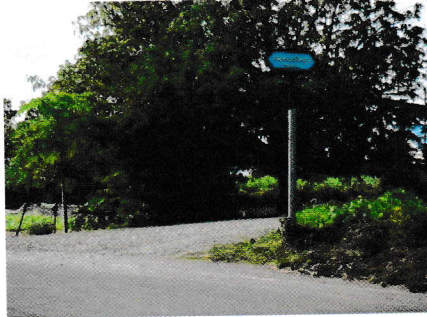
กม.0+000 (จุดเริ่มต้นโครงการ)