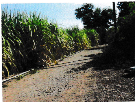
กม.0+420 (จุดสิ้นสุดโครงการ)