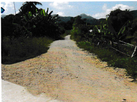
กม.1+000 (จุดสิ้นสุดโครงการ)