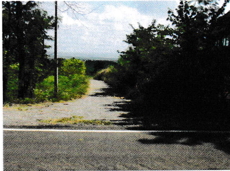
กม.0+000 (จุดเริ่มต้นโครงการ)