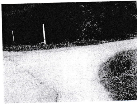
กม.0+000 (จุดเริ่มต้นโครงการ)