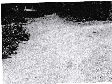
กม.1+439 (จุดสิ้นสุดโครงการ)