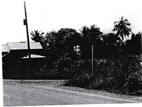
กม.0+000 (จุดเริ่มต้นโครงการ)