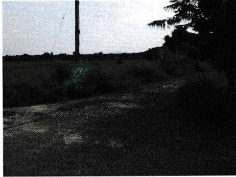
กม.0+000 (จุดเริ่มต้นโครงการ)