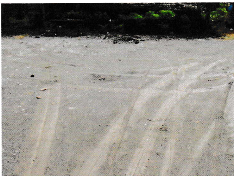
กม.0+207 (จุดสิ้นสุดโครงการ)