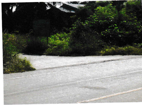
กม.0+000 (จุดเริ่มต้นโครงการ)