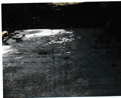
กม.0+090 (จุดสิ้นสุดโครงการ)